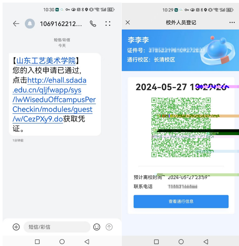
短信提醒及入校凭证